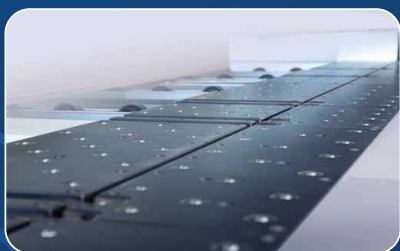
ВОЗДУШНАЯ ПОДУШКА в зоне раскроя Защищает деликатные материалы от царапин