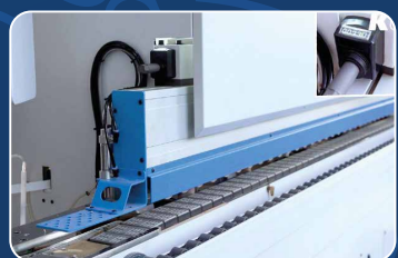
ЭЛЕКТРОПРИВОД ПРИЖИМНОЙ БАЛКИ