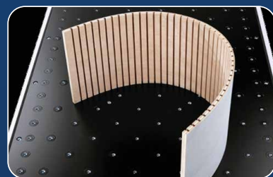
РЕГУЛИРОВКА ПОДРЕЗНОЙ ПИЛЫ С ПУ - Увеличенная площадь фиксации - Фрикционные подушки - Демпфирующие элементы