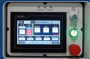
ИНТУИТИВНОЕ УПРАВЛЕНИЕ — БЕЗ ЛИШНИХ ДЕЙСТВИЙ Настройка за секунды