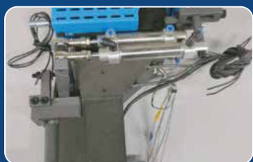
БЫСТРОСМЕННАЯ ВЕРХНЯЯ КЛЕЕВАЯ ВАННА Нагрев за 15 минут и замена за 1 минуту