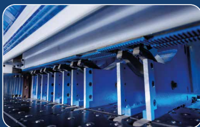
ДВУХПАЛЬЦЕВЫЕ ЗАХВАТЫ - Увеличенная площадь фиксации - Фрикционные подушки - Демпфирующие элементы