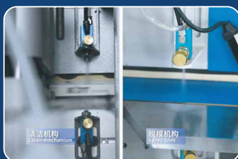
УЗЛЫ РАСПЫЛЕНИЯ Чистое кромление без клеевых следов