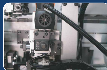
УЗЕЛ ROUND Формирует идеальные закругления кромки