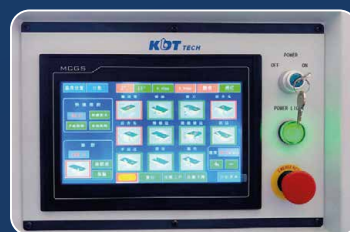
СЕНСОРНЫЙ ПУЛЬТ УПРАВЛЕНИЯ 10"