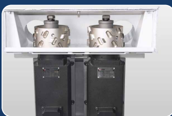
ПРИФУГОВКА Ровный шов без зазоров для EVA и PUR