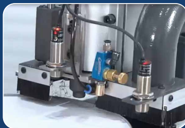
ДВЕ ОПЕРАЦИИ ЗА ОДНУ УСТАНОВКУ ДЕТАЛИ Кромление и фрезеровка свесов