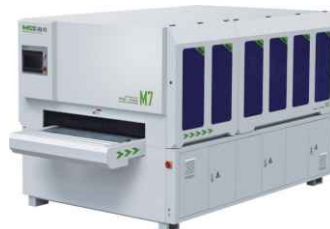
Шлифовальный станок KING 1300-M7

высокая производительность и автоматизация