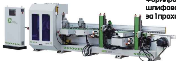
Автоматический кромкошлифовальный станок MSS SIDE K2S2W2

Формирование и шлифование кромки за 1 проход