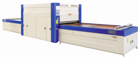
Пресс с избыточным давлением T2M 2680F

16-18 марта 2021 Павильон №3 Экспоцентр на Красной Пресне Москва, Краснопресненская наб., 14